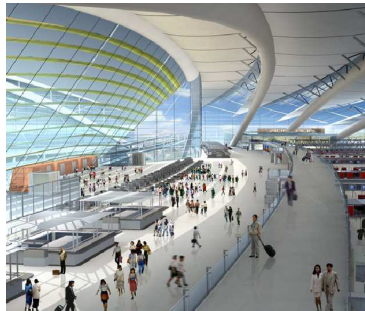
Aéroport de Chengdu Shuangliu, vue intérieure du projet de terminal