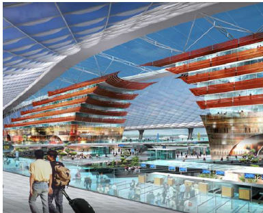
Aéroport de Kunming, vue intérieure du projet de terminal

Pour la première fois, certains projets audacieux présentés lors de concours sont par ailleurs exposés, tels en Chine le concept futuriste du terminal de l'aéroport de Kunming et l'extension de l'aéroport de Chengdu Shuangliu, ou le projet de Grand Théâtre en forme de croissant de lune à Alger.