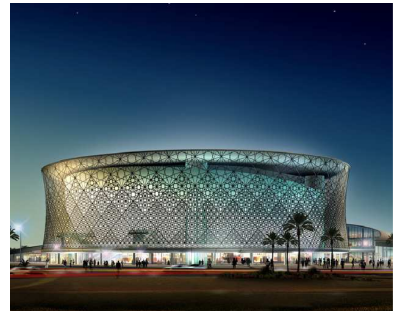
Grand théâtre d'Alger, vue nocturne.

Ergonomique et facile d'utilisation, le site se présente de façon originale avec 5 menus déroulants, offrant une visibilité transversale sur l'ensemble des contenus à travers la signature d'ADPI : "ADPI worldwide solutions from airport design...to city developments".