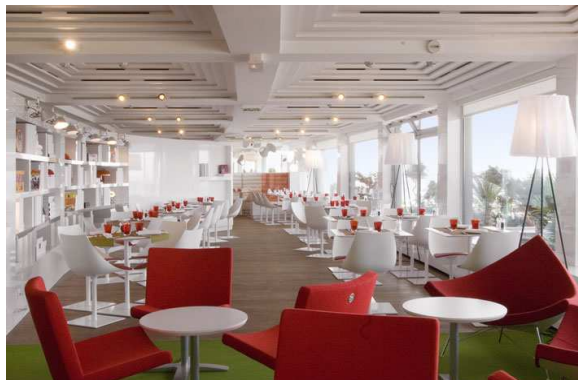
Nouveau restaurant "La Terrasse", 3 ambiances pour accueillir les passagers avec une vue panoramique sur l'aéroport et Paris

Grâce à ces nouveaux aménagements, le Terminal 1, qui est aussi le Hub français de Star Alliance, peut ainsi accueillir près de 11 millions de passagers par an dans les meilleures conditions.